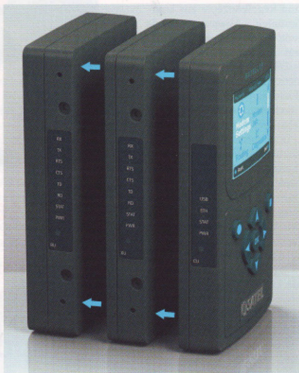
Bild 1. Das digitale Datenfunksystem ist modular aufgebaut und besteht aus einer Datenfunkeinheit, einer Zentraleinheit und einer Erweiterungseinheit für individuelle Anpassungen an Kundenbedürfnisse

An der Zentraleinheit befinden sich zudem verschiedene Funktionstasten und optional ein farbiges Display. Die Zentraleinheit und das Basismodul gibt es mit