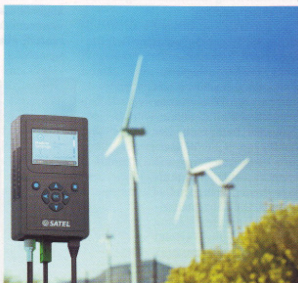
Bild 3. Das Datenfunksystem eignet sich gut für die Kommunikation und Überwachung von Windkraftanlagen

Typische Einsatzbereiche für das digitale Datenfunksystem finden sich vor allem in Anwendungen, in denen Anlagenteile miteinander kommunizieren müssen, die sich nur sehr schwer oder gar nicht mit Kabeln verbinden lassen. Windkraftanlagen sind hier ein klassisches Beispiel (Bild 3). Sie werden oft in entlegenen Gebieten, wie in Küstenbereichen, installiert, um die Geräuschbelastung für den Menschen möglichst gering zu halten. Damit Windkraftanlagen die größtmögliche Menge an Energie gewinnen können, muss man sie konsequent überwachen und entspre-